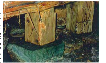
約180年前の古民家の基礎石(ゼオライト)。大引きなどは激しく腐朽しているが、基礎石と床束の接合部の腐れは全く無かった。

・ 20年程前から、地場産業活性化を想い「天然ゼオライト」を住まい造りに活用出来ないか実験棟などで研究している。研究結果から、柱下の基礎石や粒状にして床下に敷きこみ床下の調湿作用やシロアリ対策などに効果を上げている。