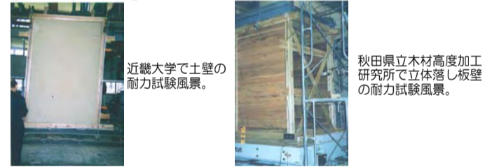
近畿大学で土壁の耐力試験風景。