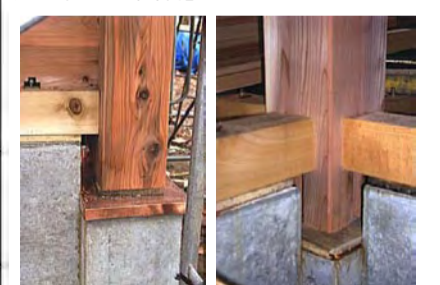
隅の通し柱と土台との大入れホゾ差し。大黒柱と4方向土台との仕口。土台大入れ差し割楔で締め付けている。で固着している