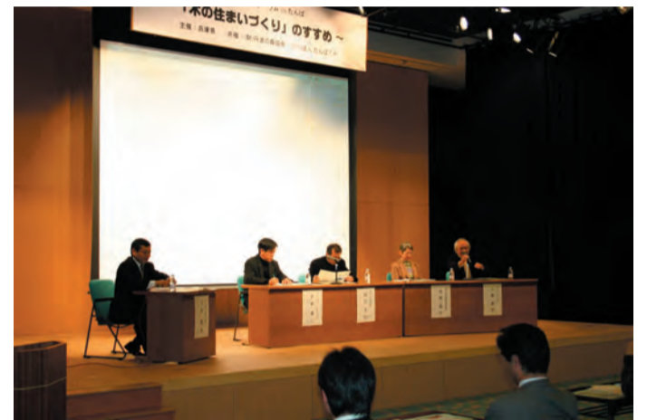
木造住宅振興フォーラム（兵庫県等との共催）

・ボランティア養成講座のカリキュラムを作成し、18年3月に開講。18年9月現在までに14回の講座を開催。延べ177名が活動。