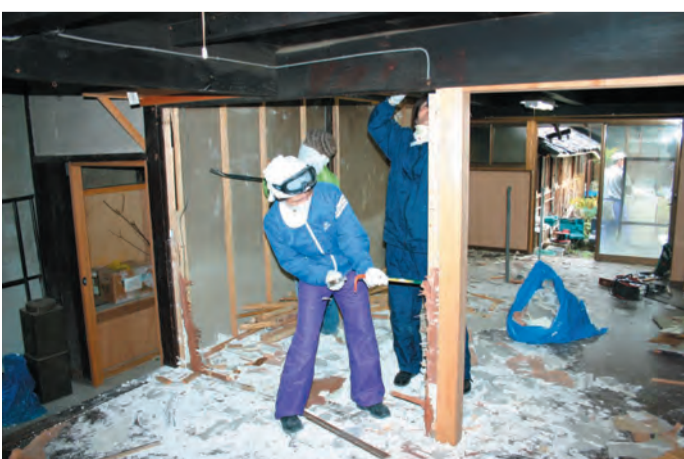
新建材部分の撤去