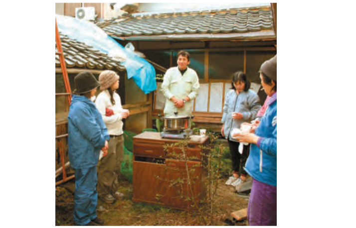
～作業の合間の楽しい休憩～ボタン汁