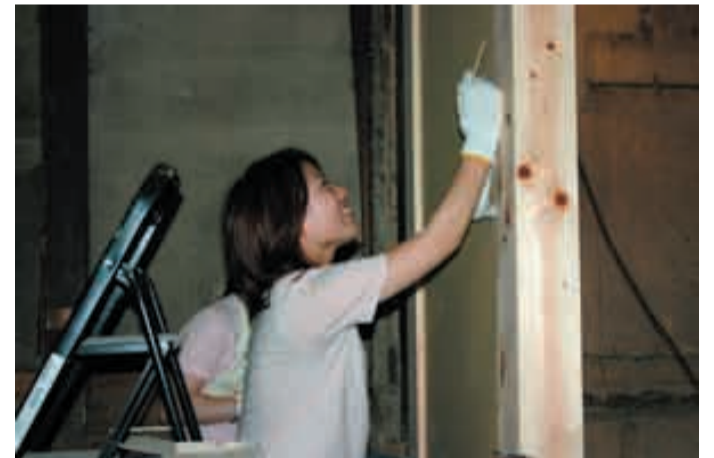
女性陣が大活躍です