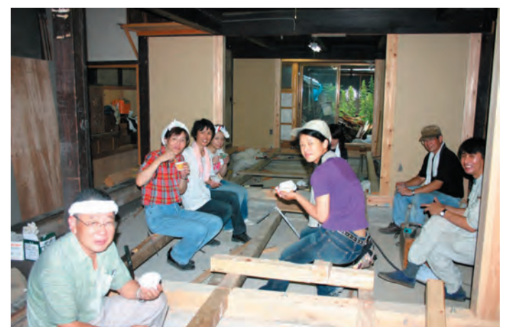
～作業の合間の楽しい休憩～アイスクリーム