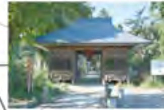
観光客を集めるお寺（恵隆寺・立木観音）