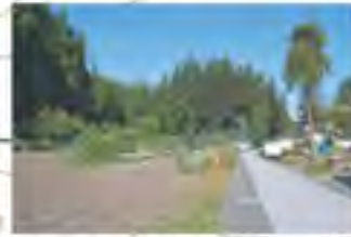
畑と一体感のある石畳の路