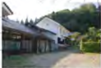
母屋と蔵を繋ぐ深い軒

当地区は普通の暮らしが営まれてきた普通のまちです。それでも、地域の人々が愛着を感じる要素も多く存在しています。 このような普通のまちで、どのようにすれば人が住み続けられるようになり、また、地域は何をすれば、居住環境を守れるか、考えていきましょう。