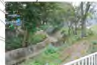
蜜の生息環境整備を目指す水無川