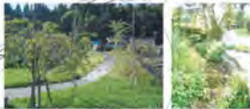
新たに整備された水辺のある公園