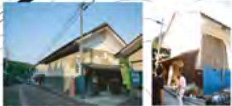
補修が望まれる蔵