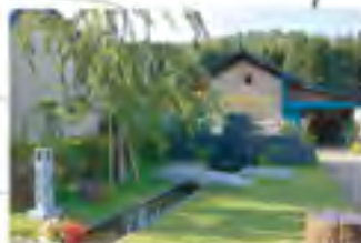
人が溜まる小公園