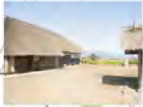
文化財となっている農家（旧五十嵐家住宅）