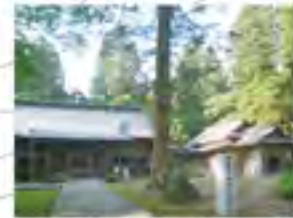
周辺からお宮参りに来る神社（心清水八幡神社）