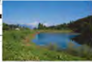
大きな池を持つ緑地