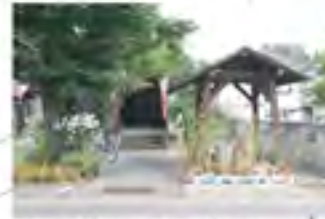
茶わん塚・下の井戸