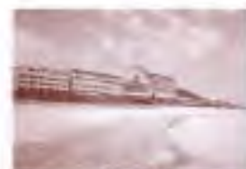
大観荘せなみの湯