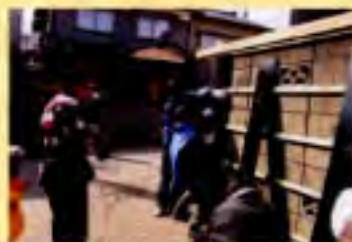
市民による黒塀作り風景

村上天では近年、市民の力により、生活空間である「町屋」の内部を公開する取組みで訪れる人が増え始めました。特に3月の「町屋の人形さま巡り」、9月の「町屋の屏風まつり」は全国区のイベントとして高く評価され、約2ヶ月の間に全国から10万人を超える人が訪れるようになりました。また昔ながらの黒塀を復活させようと「黒塀一枚千円運動」が起こり、市民の力で現在150mの黒塀ができています。これら行政に頼らぬ村上市民の活動と成果は、一時間のテレビ番組化され全国放映されたり、更に総務省、国土交通省、内閣府など国からも認められるまでになりました。衰退の一途をたどっていた町にとって希望の光が差し込み、長い間低迷してきた中心市街地が元気を取り戻しつつあります。ただこの活気も3月と9月に集中しており、一年を通しての活性化にはもう一步の努力が必要です。その一步とは町屋の外観を村らしい魅力ある町屋に再生していくことにあると考えるのです。