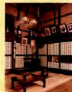
町屋の中に入ると、昔ながらの空間が残されています。