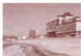
夕映えの宿 汐美荘